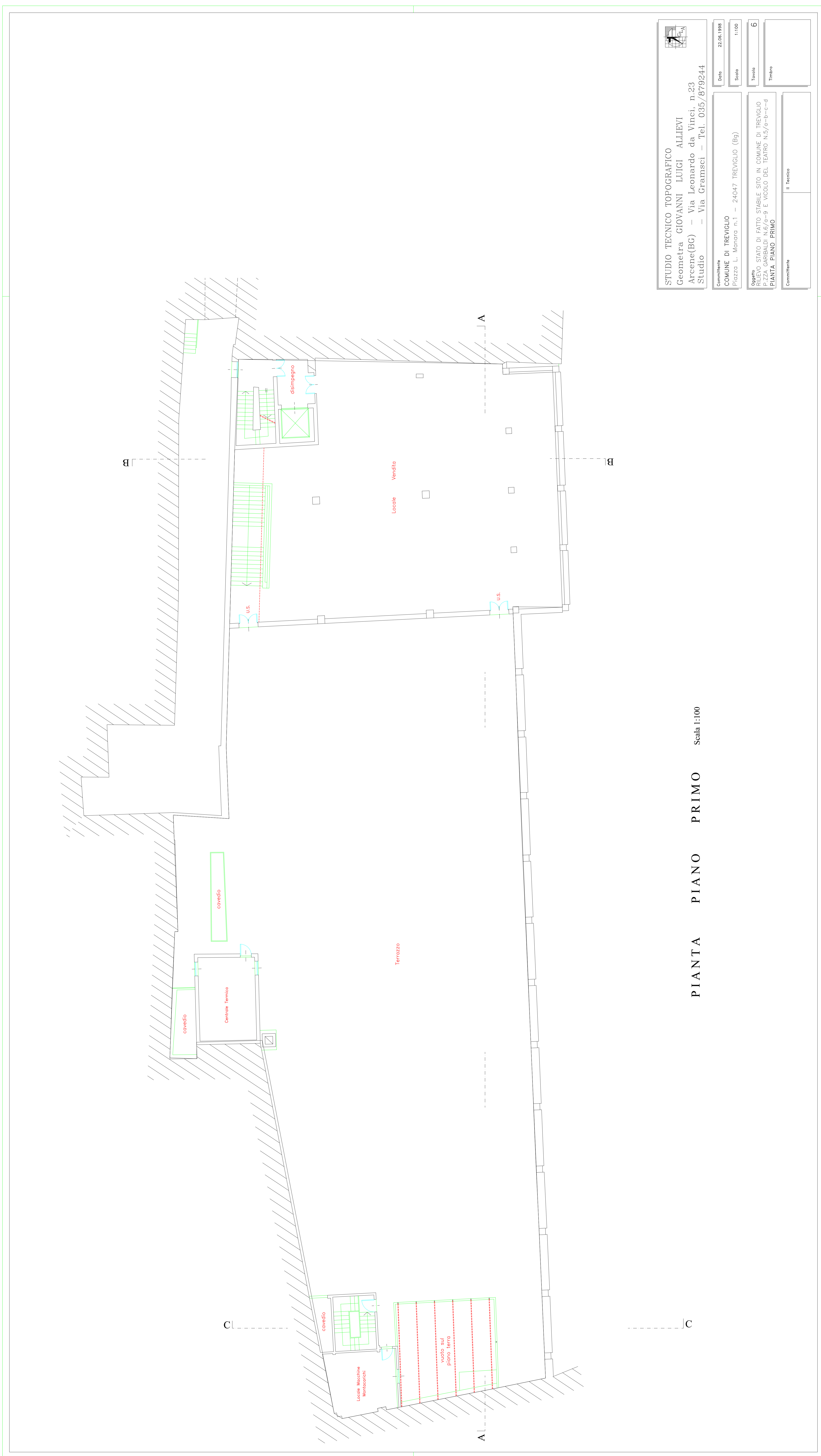
PIANTA PIANO PRIMO Scala 1:100