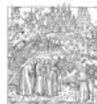
Ordine degli Ingegneri della Provincia di Bergamo