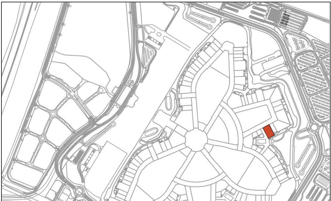
Ubicazione del lotto del Padiglione Italia nel sito espositivo di EXPO 2020 Dubai

Il Padiglione Italia, inoltre, sarà collocato in prossimità dei Padiglioni di Germania, India e Stati Uniti. In particolar modo, la vicinanza al Padiglione indiano rappresenta un particolare vantaggio in termini di attrattività, poiché saranno previsti circa 5 milioni di visitatori provenienti dai paesi dell'Asia e del sud-est asiatico, dei quali, stando alle stime, la maggior parte sarà di nazionalità indiana.