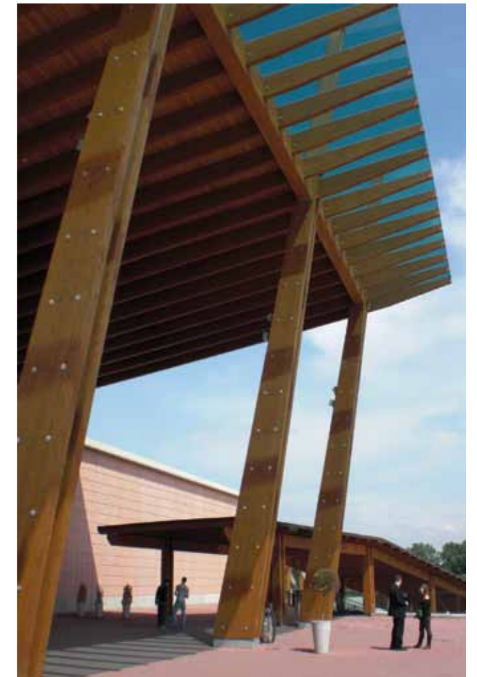
Ingresso Centro Commerciale

Luogo: Rozzano (MI) Dimensioni in pianta: 22,5 x 30,5 m Superficie coperta: 700 m 2 Altezza pilastri: 18 m