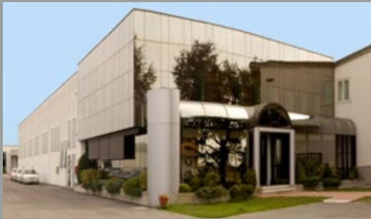
Sede: Bagnara di Romagna