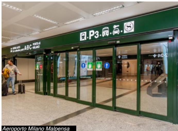
Aeroporto Milano Malpensa