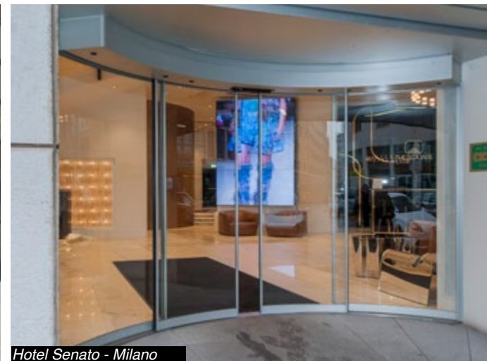
Hotel Senato - Milano