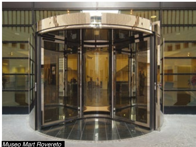
Museo Mart Rovereto