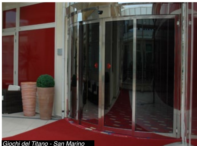
Giochi del Titano - San Marino