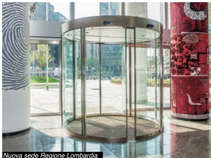
Nuova sede Regione Lombardia